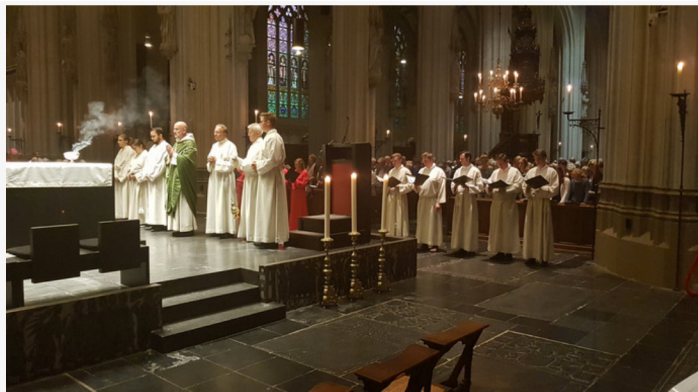
▲ De speciale Gregoriaanse mis met Herman Finkers.